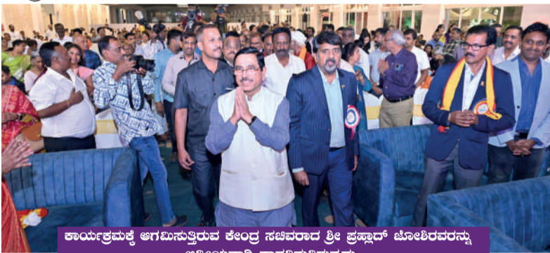
ಕಾರ್ಯಕ್ರಮಕ್ಕೆ ಆಗಮಿಸುತ್ತಿರುವ ಕೇಂದ್ರ ಸಚಿವರಾದ ಶ್ರೀ ಪ್ರಹ್ಲಾದ್ ಜೋಶಿರವರನ್ನು ಅಭ್ಯಯವಾಗಿ ಸ್ವಾಗತಿಸುತ್ತಿರುವುದು