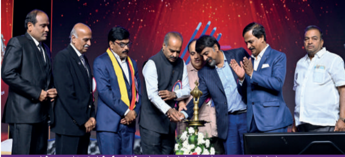
ಆರನೇ ವಾಸವಿ ಎಕ್ಸಲೆನ್ಸ್ ಪ್ರಶಸ್ತಿ ಪ್ರಧಾನ ಸಮಾರಂಭ ಉದ್ಘಾಟಿಸುತ್ತಿರುವ ಸಂಸದರಾದ ಶ್ರೀ ಪಿ ಸಿ ಮೋಹನ್ ಹಾಗೂ ಇತರ ಗಣ್ಯರು

ಸಾಧಕರಾಗಲು ನಿರ್ದಿಷ್ಟವಾದ ಕ್ಷೇತ್ರಗಳೇನಿಲ್ಲ, ಸಾಧನೆಗೆ ನೂರಾರು ಕ್ಷೇತ್ರಗಳು, ಹತ್ತಾರು ದಾರಿಗಳಿವೆ. ಯಾವ ಕ್ಷೇತ್ರದಲ್ಲಿ ನಾವು ಸಾಧಿಸಲು ಆಶಿಸುತ್ತೇವೆಯೋ ಅದು ನಮ್ಮ ಇಚ್ಛೆಗೆ ಬಿಟ್ಟದ್ದು. ಒತ್ತಡದ ಪರಿಸ್ಥಿತಿಯನ್ನು ಎದುರಿಸುವ ಶಕ್ತಿ ಇರುವವರಿಗೆ ಮಾತ್ರ ಸಾಧನೆ ಮಾಡುವ ಸಾಮರ್ಥ್ಯ ಇರುತ್ತದೆ. ಯಶಸ್ಸು ಎನ್ನುವುದು ಒಮ್ಮೆಲೆ ಸಿಗುವುದಿಲ್ಲ, ನಿತ್ಯ ನಿರಂತರ ಪ್ರಯತ್ನಗಳ ನಂತರವಷ್ಟೆ ಯಶಸ್ಸನ್ನು ಅಪೇಕ್ಷಿಸಬಹುದು. ಅಂತಹ ಧೀಮಂತ ಸಾಧಕರನ್ನು ಹುಡುಕಿ ಕರೆತಂದು ಅವರನ್ನು ಅಭಿನಂದಿಸುವ ಮೂಲಕ ಇತರರಿಗೂ ಸ್ಪೂರ್ತಿ ಅಗುತ್ತದೆ. ಅಂತಹ ಸಾಧಕರನ್ನು ಗುರುತಿಸಿ, ಸನ್ಮಾನಿಸಿ, ಸಮಾಜಕ್ಕೆ ಪರಿಚಯಿಸುವ ಮಹೋನ್ನತ ಕಾರ್ಯವನ್ನು ಪ್ರತೀ ವರ್ಷವೂ ಮಾಡುತ್ತಾ ಸಾಧಕರ ಮುಡಿಗೇ ಪ್ರಶಸ್ತಿಯ ಕಿರೀಟ ಧಾರಣೆ ಮಾಡಿ ಅಭಿನಂದಿಸುವ ಸತ್ವಪೂರ್ಣ ಕಾರ್ಯಕ್ರಮವನ್ನು ಕರ್ನಾಟಕ ಆರ್ಯವೈಶ್ಯ ಮಹಾಸಭೆಯು