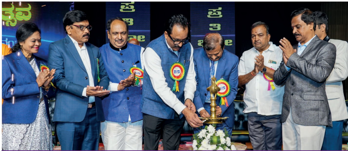
15ನೇ ಪ್ರತಿಭೋತ್ಸವ ಕಾರ್ಯಕ್ರಮ ಉದ್ಘಾಟನೆ ಮಾಡುತ್ತಿರುವ ಡಾ|| ಸಿ.ಎನ್. ಮಂಜುನಾಥ್ ಮಾನ್ಯ ಸಂಸದರು, ಬೆಂಗಳೂರು ಗ್ರಾಮಾಂತರ ಹಾಗೂ ಡಾ|| ಎಸ್.ಸೋಮನಾಥ್ ಮಾಜಿ ಅಧ್ಯಕ್ಷರು, ಇಸ್ರೋ ರವರೊಂದಿಗೆ ಇತರ ಗಣ್ಯರು

ಯಾವುದೇ ವ್ಯಕ್ತಿಯ ಸಂಪೂರ್ಣ ಬೆಳವಣಿಗೆಗೆ ಶಿಕ್ಷಣವು ಅವಶ್ಯಕತೆಯಿದೆ. ಒಂದು ಮಗುವಿನ ಶಾರೀರಿಕ, ಮಾನಸಿಕ ಹಾಗೂ ಅಧ್ಯಾತ್ಮಿಕ ಶಕ್ತಿಗಳನ್ನು ಪೂರ್ಣ ವಿಕಾಸವನ್ನುಂಟು ಮಾಡುವುದೇ ಶಿಕ್ಷಣ. ಒಬ್ಬರ ಜೀವನವನ್ನು ಸರಿಯಾದ ದಿಕ್ಕಿನಲ್ಲಿ ರೂಪಿಸುವ ಸಾಮರ್ಥ್ಯವನ್ನು ಶಿಕ್ಷಣ ಹೊಂದಿದೆ. ಶಿಕ್ಷಣದ ಬೆರುಗುಳು ಕಡಿ ಇರಬಹುದು ಆದರೆ ಅದರ ಫಲ ಸಿಂಹಿಯಾಗಿಯೇ ಇರುತ್ತದೆ ಎಂದು ನೂರಾರು ವರ್ಷಗಳ ಹಿಂದೆಯೇ ಅರಿಸ್ಟಾಟಲ್‌ರಂತಹ ಜ್ಞಾನಿಗಳು ನೀಡಿರುವ ಸಂದೇಶ ಅಚ್ಚಾರ್ಥವಾಗಿ ಸತ್ಯ ಅಲ್ಲವೇ?